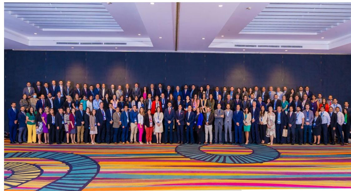
San Salvador 2022

¡ Muchas gracias por su amable atención !