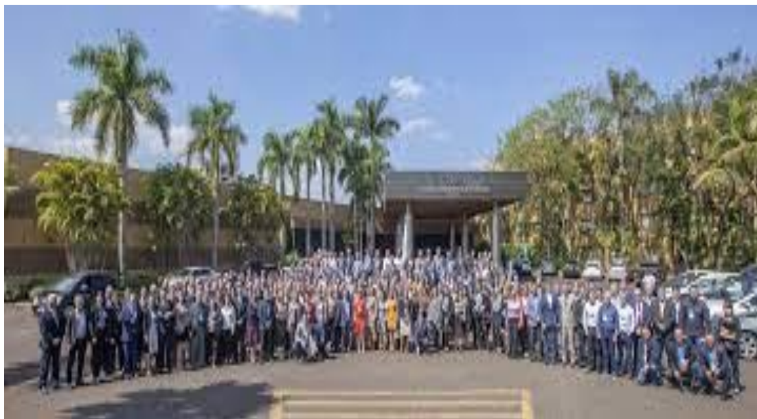
Foz de Iguazú 2019